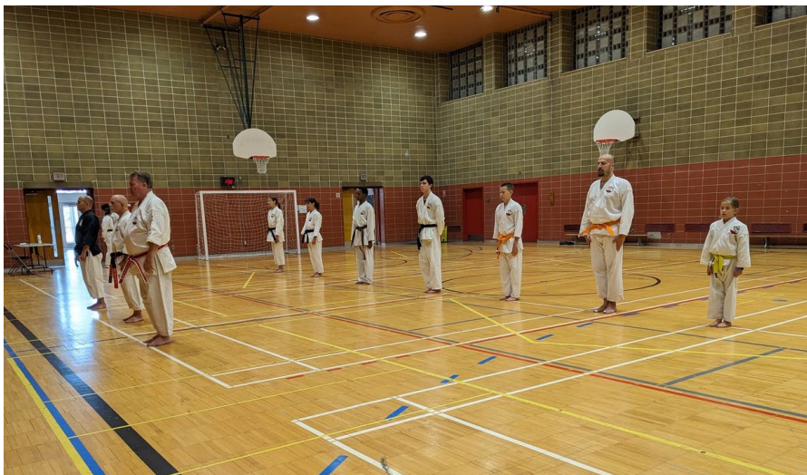
Coloured belt class at Gadbois Dojo