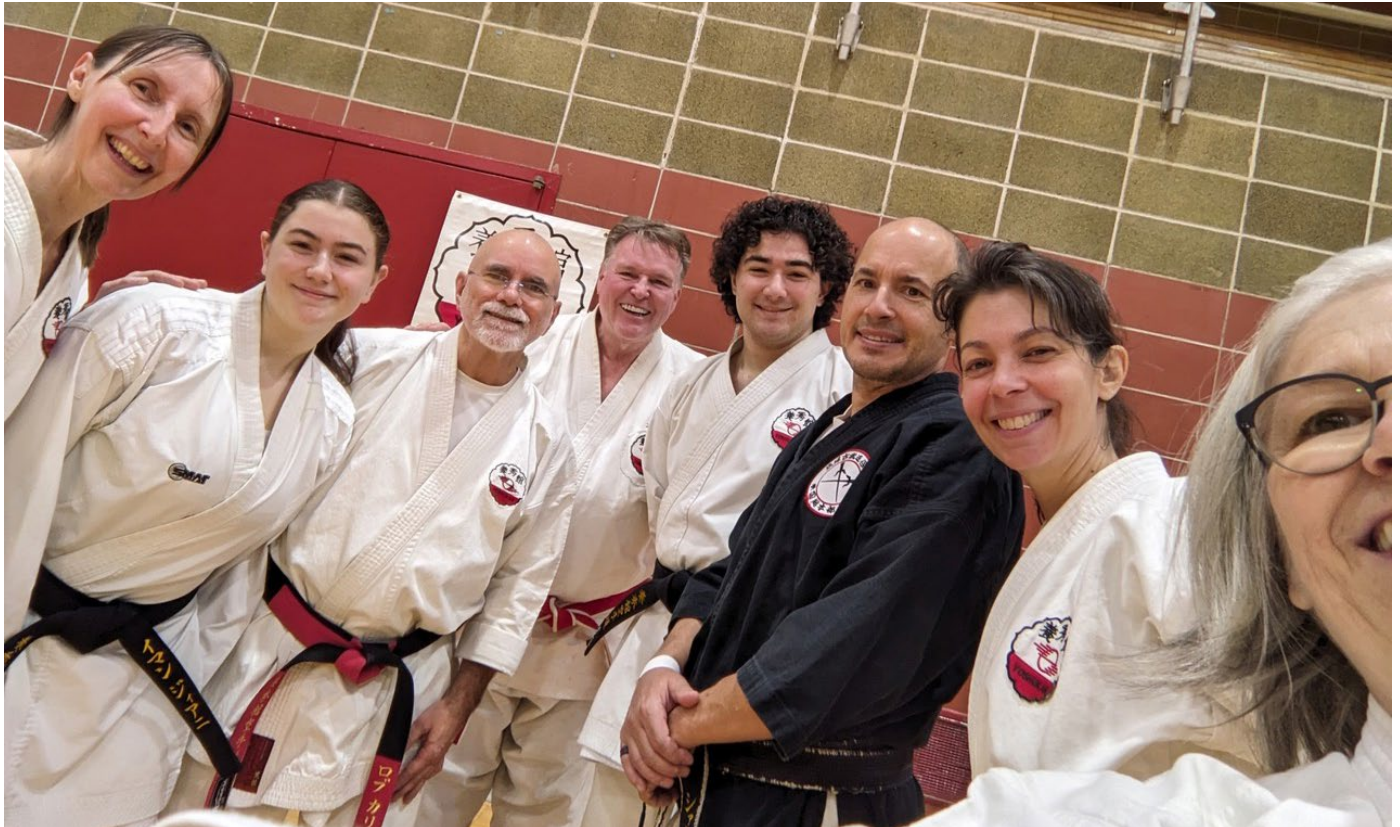
Yoshukan Black Belt group photo

Saturday morning with a continuation of Eiku kata practice and SHI HO HAI BUNKAI practice for the junior grades. The Black Belt class reviewed our Yoshukan kata (and then did individual demonstrations!). As always a great time to catch up and reinforce our common bond and friendships!